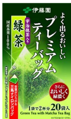
ティーバッグ20袋入り 362円