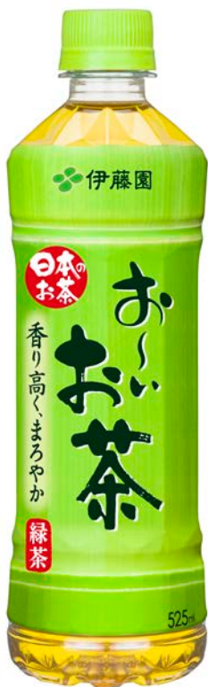
「お〜いお茶」パッケージ裏面に 入賞作品 2,000 句掲載